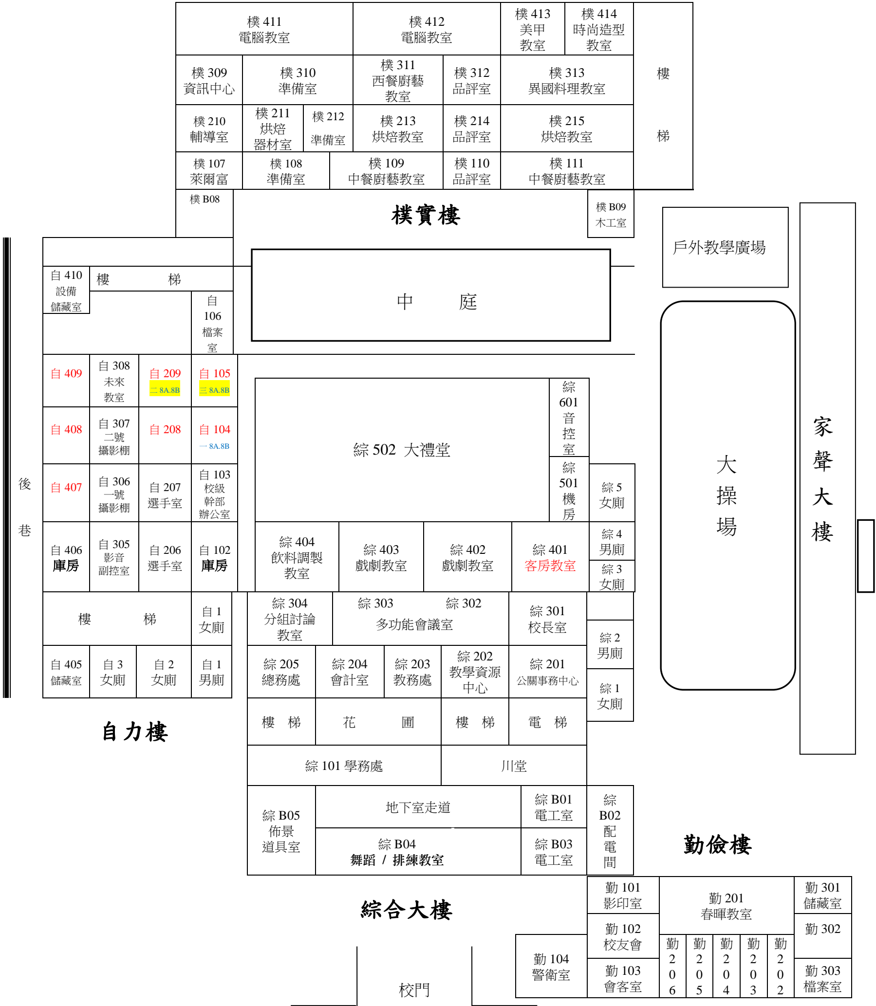
育達高中 校園平面簡圖（113學年度第2學期 114年2月12日）